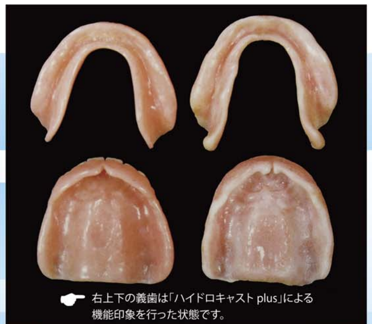
右上下の義歯は「ハイドロキャスト plus」による機能印象を行った状態です。

柔らかさと機能的柔軟性を数週間維持できるマテリアルにより、外見だけでは見極めが困難な咀嚼機能中の粘膜面の状態を鮮明に現し、粘膜の健康状態を容易に判別できます。単なる機能印象の使用に留まらず、機能印象を行いながら粘膜の健康状態を診断し、粘膜の治癒を促進できることは「ハイドロキャスト plus」の大きな特徴です。削合や調整も容易に行うことができます。